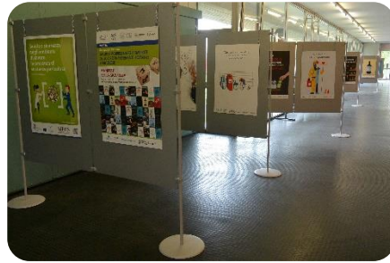
La mostra negli ambienti del Dipartimento di Medicina dell'Università degli Studi di Brescia dal 15 maggio al 3 giugno 2019