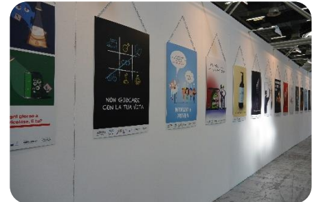
L'allestimento dei manifesti in occasione della Fiera Ambiente Lavoro a Bologna dal 15 al 17 ottobre 2019